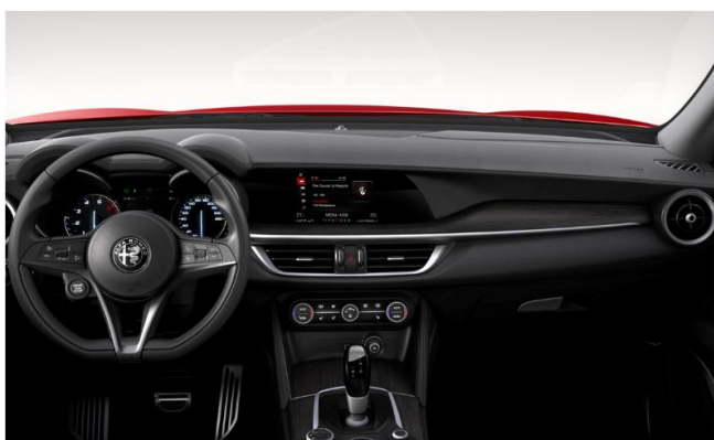
Вставка на передній панелі натуральне дерево, Grey Wood